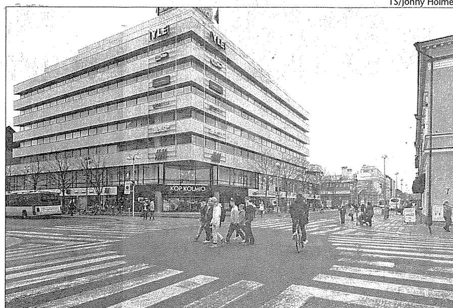
Kevät 2011. KOP-kolmiolle tehtiin 2007 mittava julkisivuremontti. Voimakas valkoisuus katosi katukuvasta.

Tilalle nousi Turun keskustan siihen mennessä massiivisin rakennus, noin 5600-neliöinen, yhdeksänkerroksinen KOP-kolmio. Suunnitelukilpailun voitti arkkitehti